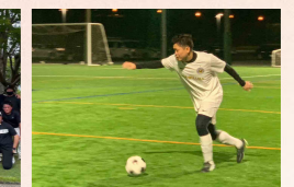
横浜 JCFC (サッカー同好会)

※この他にもマリン倶楽部(マリンスポーツ)、パーバリアンクラブ(アウトドア)、うさぎとかめ(登山)があります。