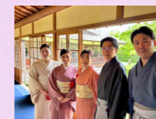
青苔会 (茶道同好会)

(一社) 横浜青年会議所には、サッカーや野球、茶道など、趣味を通じた交流を目的とした同好会がいくつも存在します。これらの同好会では、会員同士が趣味を共有し、リラックスした環境で親睦を深める機会となっています。