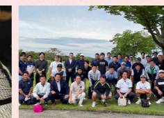
横浜 JC じゃがいもクラブ (ゴルフ同好会)