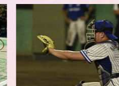
横浜 JC トンネル倶楽部 (野球同好会)