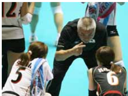
選手たちにアドバイスする柳本監督